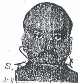
S. [Name] Advocate Jail Road, [Location]

कार्यालय न्यायिक अधिकारी * * * * * 30 MAY 2012 * * * * *