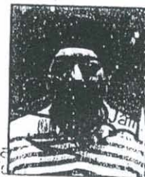
Saxena Advocate [Location]

किे उप निबन्धक 11 बरेती धयेनामा प्लाट बिसपर लोर्ड निमार्ण नही है नगरीय क्षेत्र भावु म्बूल चर्च चक्क सीमित की सम्पत्ति नही है पदाकार नगर- तीय है कालीनी मे नही है शासनादेश नं० 2756/11-2000-500/07 दि०