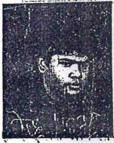
दस्तावेज लेखक रजिस्ट्री-फखनख