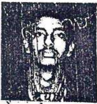
दस्तावेज लेखक रजिस्ट्री-फखनख