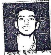
शक्र दवाब अशि दस्तावेज लेखक रजिस्ट्री-फखनख