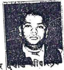
शक्र दवाब अशि दस्तावेज लेखक रजिस्ट्री-फखनख