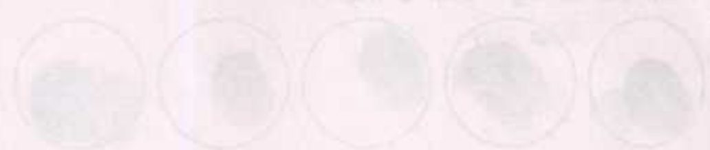
Figure 1 (continued)

Figure 1 shows the results of the experiment. The first row shows the control group, and the second row shows the experimental group. The results are as follows: