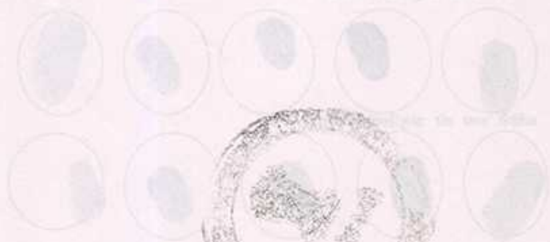
Figure 2 (continued)

The results of the experiment are shown in Figure 2.