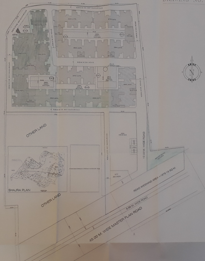
SITE PLAN SCALE:-1:500