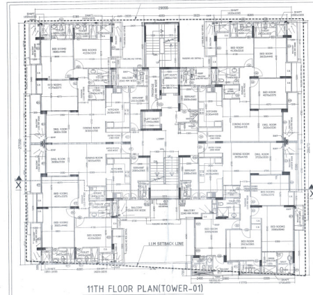
11TH FLOOR PLAN(TOWER-01)