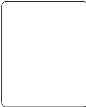
नामित का फोटो