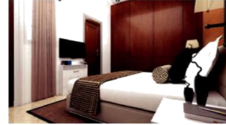
An Artist's impression of a Bed Room

लॉन व पार्क: सुबह शाम हरे भरे केन्द्रीय लॉन में फुरसत के पलों में समय बिताने और पार्क में लगे झूलों पर खेलते हुए बच्चे, सोसाइटी के निवासियों के लिए बनेगा एक जीवन्त स्थान।